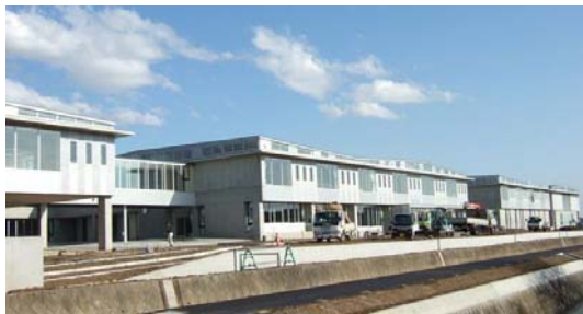
開設間近！、桜山小学校

第四十七回 全日本学校歯科保健 最優良学校 最優秀校受賞 文部科学大臣表彰 六郷小学校