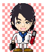
(画・会長ブログより)