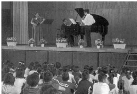
室内楽の調べ(大類小)

数多くの保護者・先生方、そして子ども達と心豊かな時間を共有する事ができました。 第二回セミナーは十一月月上旬に携帯電話の問題について。 第三回は一月中旬を予定しています。