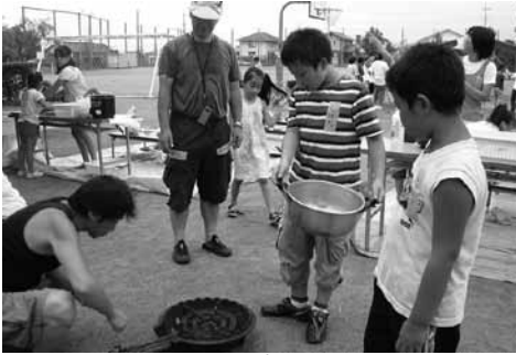
おやじの会 (長野小)

【長野小学校】 今年度から新たに「おやじの会」(父親主体のボランティアサークル)、「たんぼの会」(読み聞かせのボランティアサークル)が正式に加わって、活動がより活発になってきました。今後もPTA会員一人一人が積極的に参加し、子ども達が健全に成長していけるよう取り組んでいきたいと思っています。