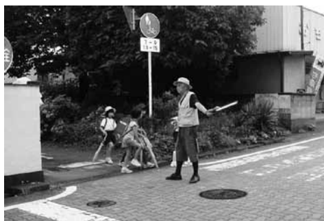
ボランティアによる交通指導 (吉井小)

吉井小では、朝の登校時には、防犯パトロールボランティアの方々が、通学路に立ち、下校時には、児童の保護者全員に当番をわりあて、地区ごとに安全パトロールを行うなど、「地域安全の向上」を目指しています。