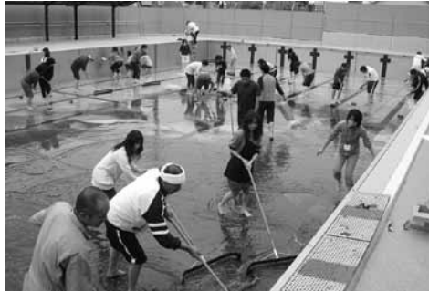
環境美化活動 (箕郷中)

年間のうち一回は役員を経験して頂く」役員体制がスタートしました。これにより校門で役員と生徒会による挨拶運動が新たに始まりました。また五月に行われた総勢164名の環境美化委員による美化活動は圧巻でした。PTA活動により多くの保護者の方々に参加していただき、生徒・先生・保護者が少しでも近づき、楽しく活動していきたいと思えます。