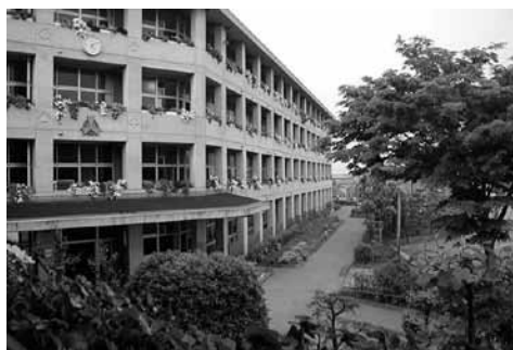
ペチュニア (矢中中)

また、地域の健全育成のために賛同された方々で作られる「ペチュニアの会」も熱心に参加していただき、まさに地域一丸となったの取り組みを行っています。これらの活動が認められ、平成18年度には環境大臣表彰をいただきました。