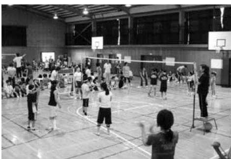
ソフトバレーボール大会 (乗附小)

「ふれあい」を合言葉に学校・PTA・地域が連携し、世代間交流を密に、子ども達の豊かな心・優しい心を育むよう活動しています。