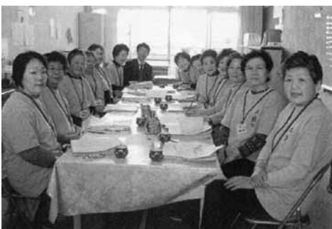
ボランティアの皆さん (大類小)

平成17年に「地域教育力有効活用モデル校」として指定を受け、「子どもたちを地域で育てる開かれた学校」を目指し、学校・家庭・地域と連携した活動を