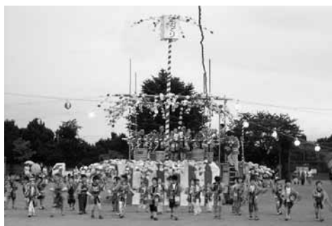
盆踊り大会 (金古南小)

『金古南小音頭』は、当時の保護者や先生、児童も参加して作られた本校オリジナル曲です。在校生だけでなく、卒業生や保護者・地域の皆さんも参加し、大きな輪になり、踊ります。そして子ども達の何よりの楽しみは、焼きそば・アイス・フランクフルト他、百円屋台でのお買い物。どの屋台も大人気です。楽しい抽選会や花火もあり、笑顔一杯の一日でした。