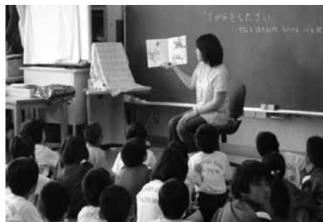
本の読み聞かせ (堤ヶ岡小)

年間7回、朝の8時15分からの15分間、一年生から四年生までの十クラスで14名のボランテ